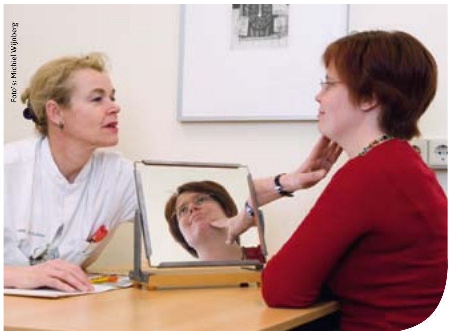
Eerste doel van mimetherapie is het leren beheersen van de mondspieren en de symmetrie te herstellen

De verwijdering is niet zonder risico's. Sterker nog: in veel gevallen worden één of meer hersenzenuwen geraakt. Dat is moeilijk te vermijden, aangezien de tumor vaak met de zenuwen vervlochten is. De gevolgen van een