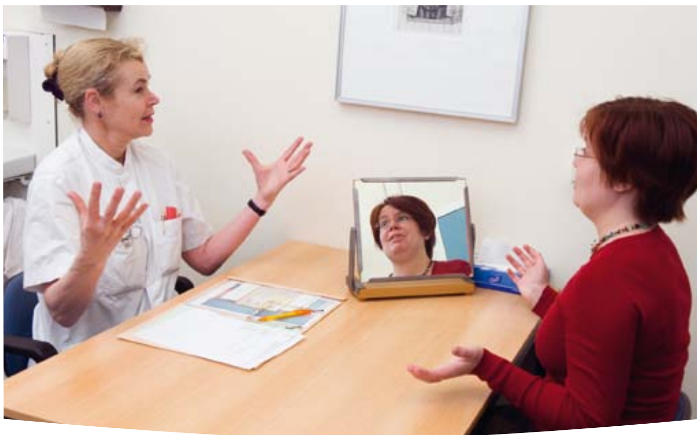
Leren om met armgebaren meer uitdrukking aan woorden te geven